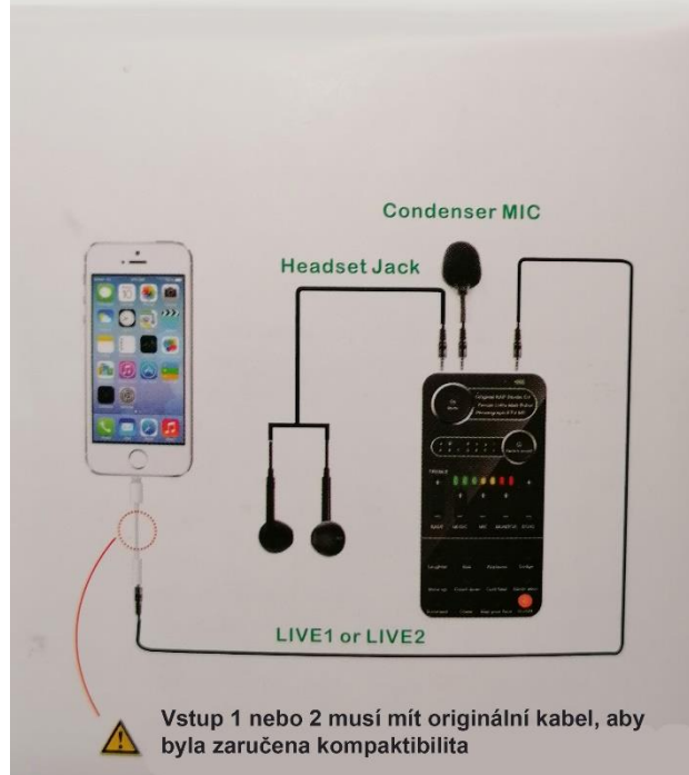
Schéma připojení mobilního telefonu, sluchátek a mikrofonu