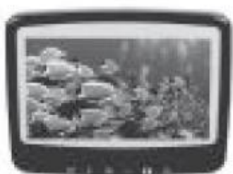
4.3 inch monitor