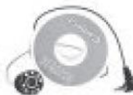
Camera with cable and reel